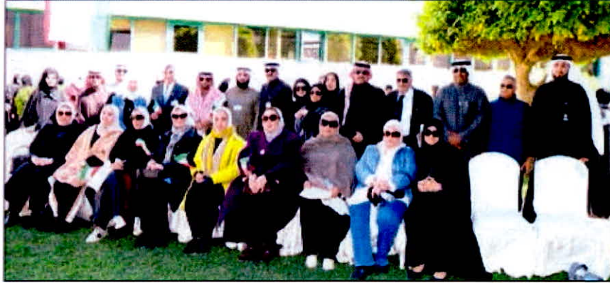
الحضور خلال الاحتفال